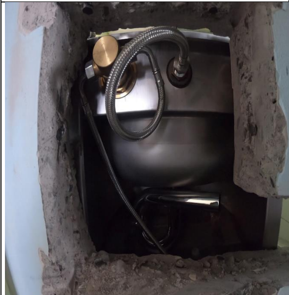
Fotografía N° 3, 8 de febrero de 2021, artefactos sanitarios de celdas, en módulo E4, 4° piso, sin instalación de redes de agua potable ni alcantarillado