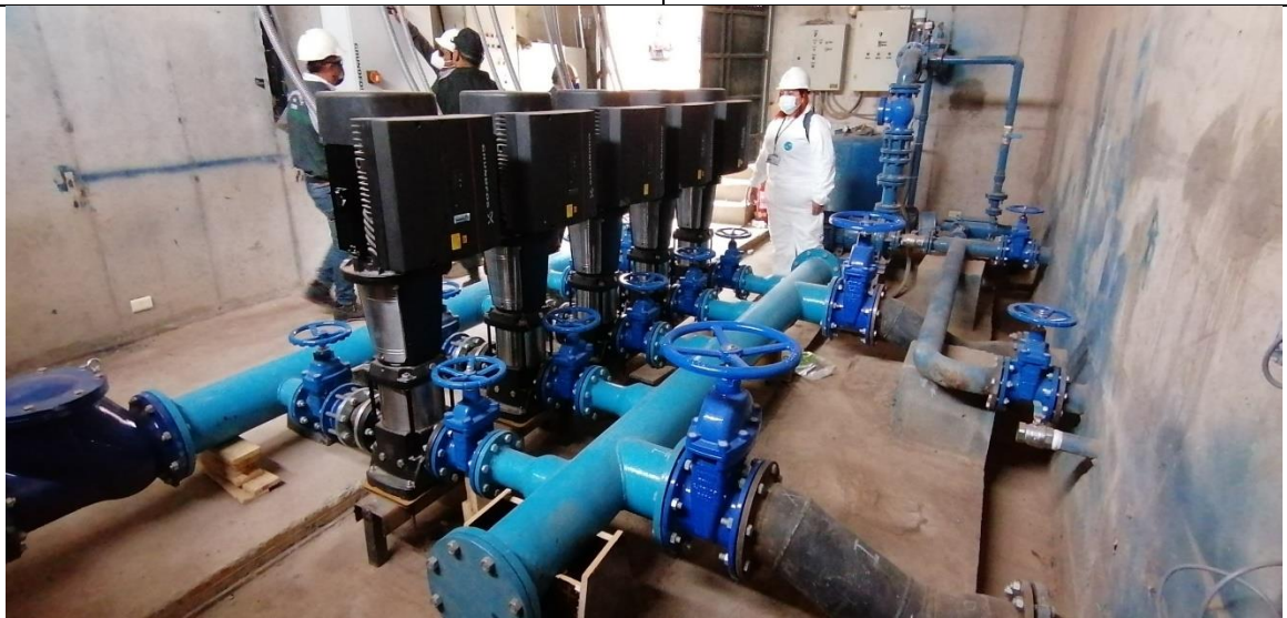
Fotografía N° 9, 23 de octubre de 2020, sistema de impulsión secundario, bombas para el aumento de presion, manifold de acero, válvulas, las cuales se encuentran soportadas sobre tableros de madera y/o perfiles de acero, sobre los que no se encuentran anclados