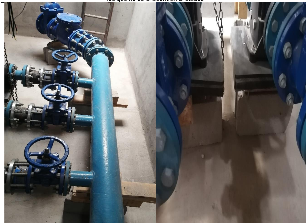
Fotografía N° 11, 23 de febrero de 2021, sistema de impulsión primario, manifold de acero, válvulas, las cuales se encuentran soportadas sobre tableros de madera, sobre los que no se encuentran anclados.