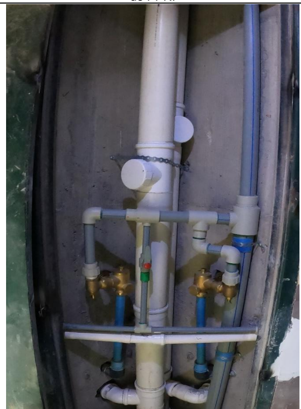
Fotografía N° 16, 8 de febrero de 2021, descarga de alcantarillado y red de agua potable verticales en shaft de 2°, 3° y 4° piso modulo B-4, se utilizó cinta galvanizada perforada para sujeción de tubo PVC Sanitario y tubo de PPR.