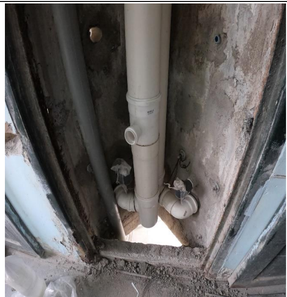
Fotografía N° 2, 8 de febrero de 2021, shaft vertical en módulo E4, 2° piso, sin conexiones a primer piso.