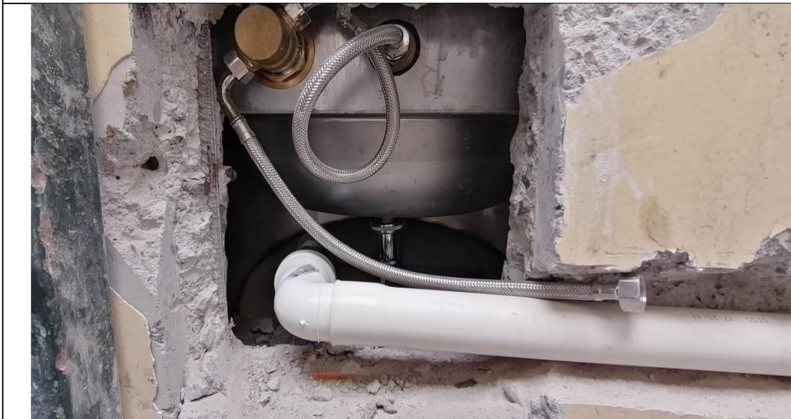
Fotografía N° 6, 23 de octubre de 2020, pasada en muro de hormigón armado del módulo B4, se aprecia la armadura a la vista.