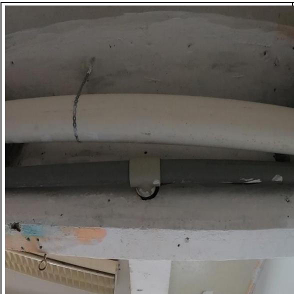
Fotografía N° 13, 8 de febrero de 2021, descarga de alcantarillado aérea, en primer piso modulo B-4, se utilizó cinta galvanizada perforada para sujeción de tubo PVC Sanitario.