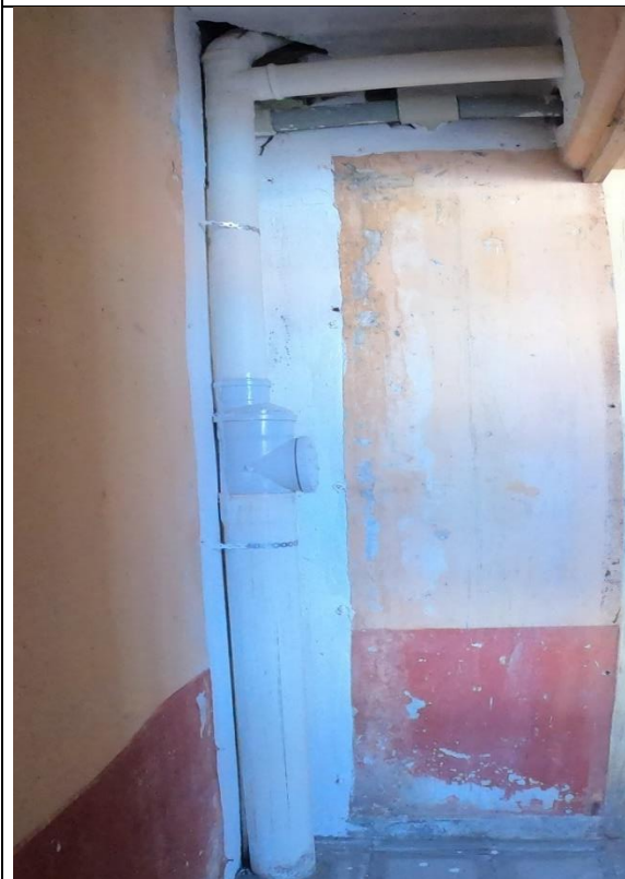
Fotografía N° 15, 8 de febrero de 2021, descarga de alcantarillado vertical, en primer piso modulo B-4, se utilizó cinta galvanizada perforada para sujeción de tubo PVC Sanitario.