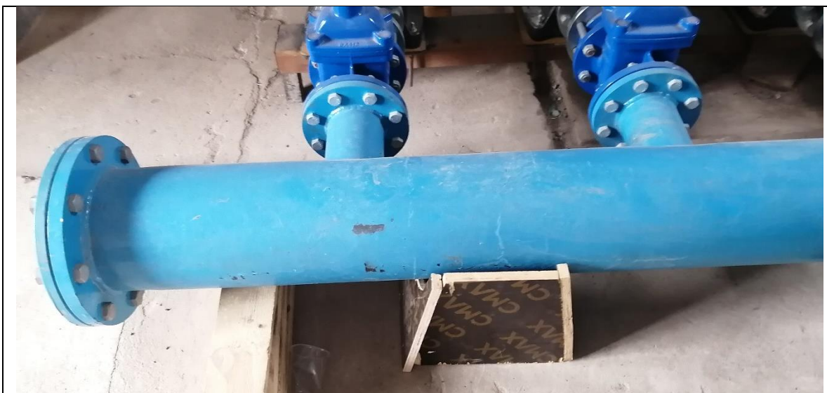
Fotografía N° 10, 23 de octubre de 2020, sistema de impulsión secundario, bombas para el aumento de presión, manifold de acero, válvulas, las cuales se encuentran soportadas sobre tableros de madera, sobre los que no se encuentran anclados