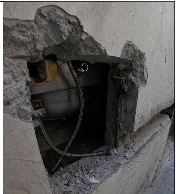
Fotografía N° 7, 8 de febrero de 2021, pasadas en muro de hormigon armado en modulo E4, desde shaft hacia celdas.