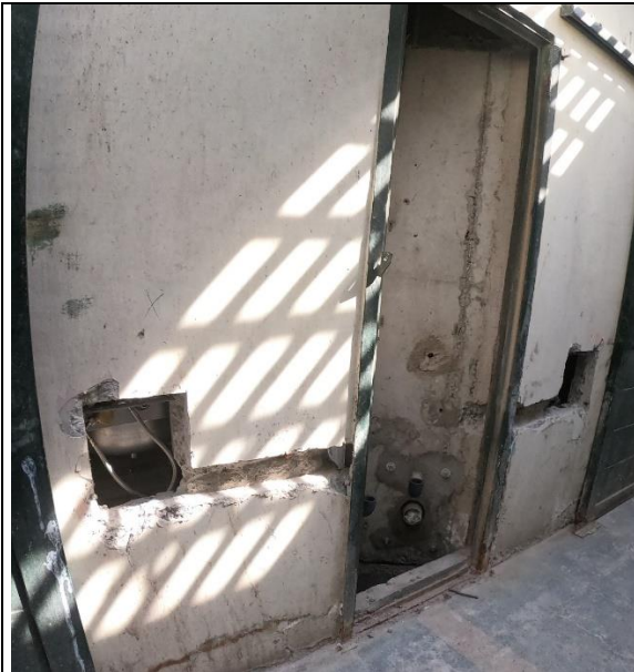
Fotografía N° 1, 8 de febrero de 2021, shaft vertical y ramal de artefactos de celdas en módulo E4, 2° piso, sin instalación de redes de agua potable ni alcantarillado