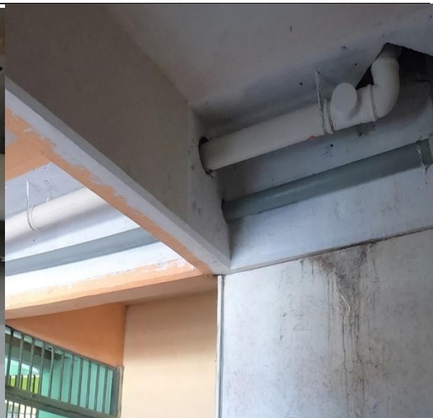
Fotografía N° 14, 8 de febrero de 2021, descarga de alcantarillado y red de agua potable aéreas, en primer piso modulo B-4, se utilizó cinta galvanizada perforada para sujeción de tubo PVC Sanitario y tubo de PPR.