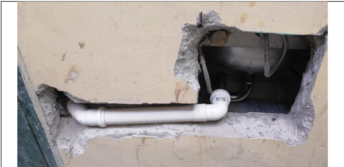
Fotografía N° 5, 23 de octubre de 2020, pasada en muro de hormigón armado del módulo B4.