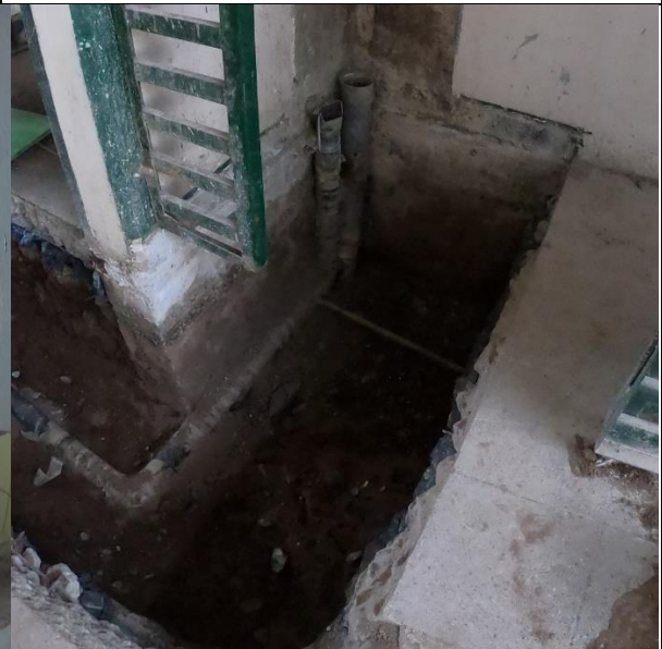
Fotografía N° 4, 8 de febrero de 2021, excavación de red subterránea en 1° piso de módulo E4, sin instalación de redes de agua potable ni alcantarillado, como tampoco retiro de redes existente.